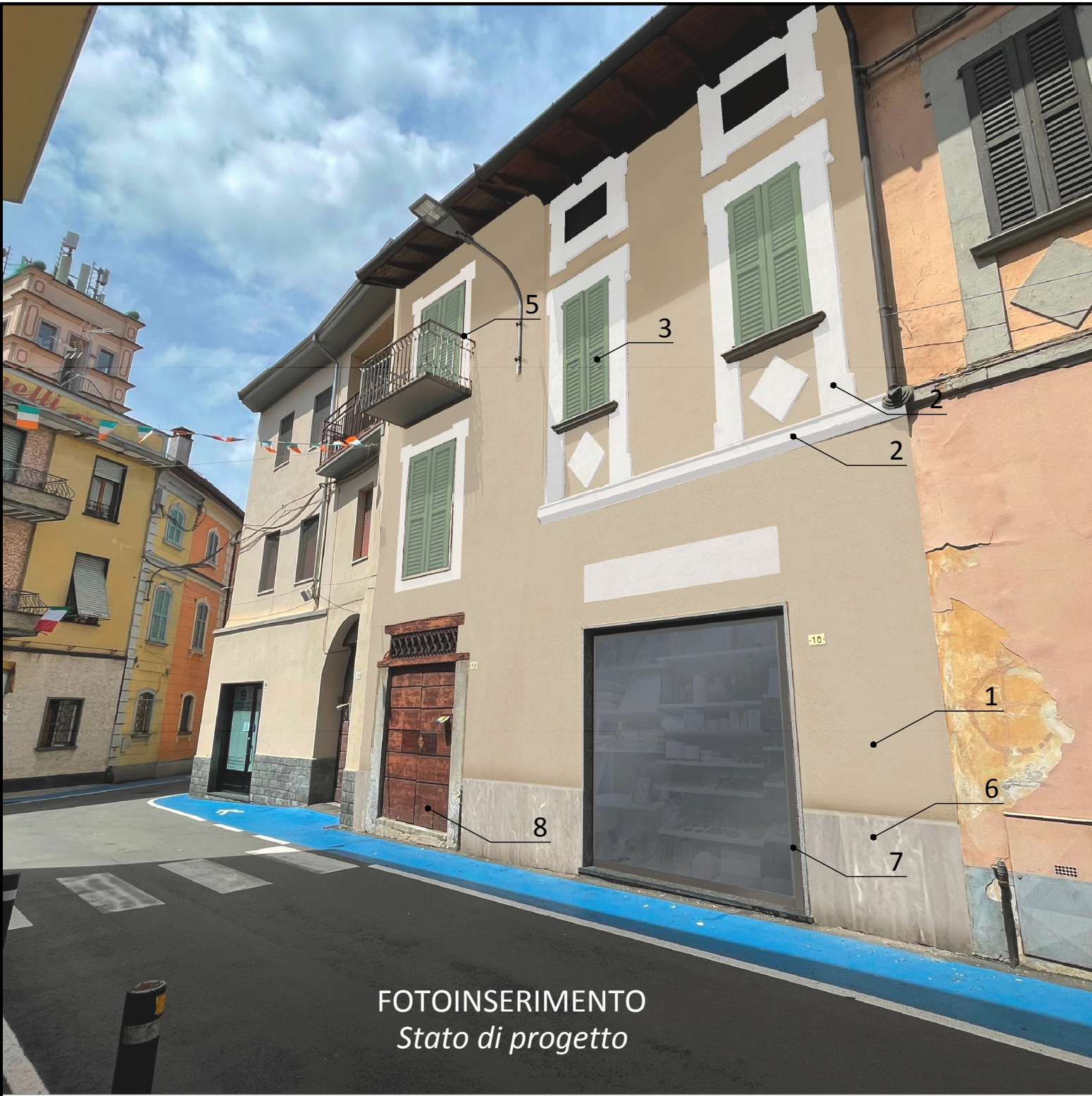
FOTOINSERIMENTO Stato di progetto