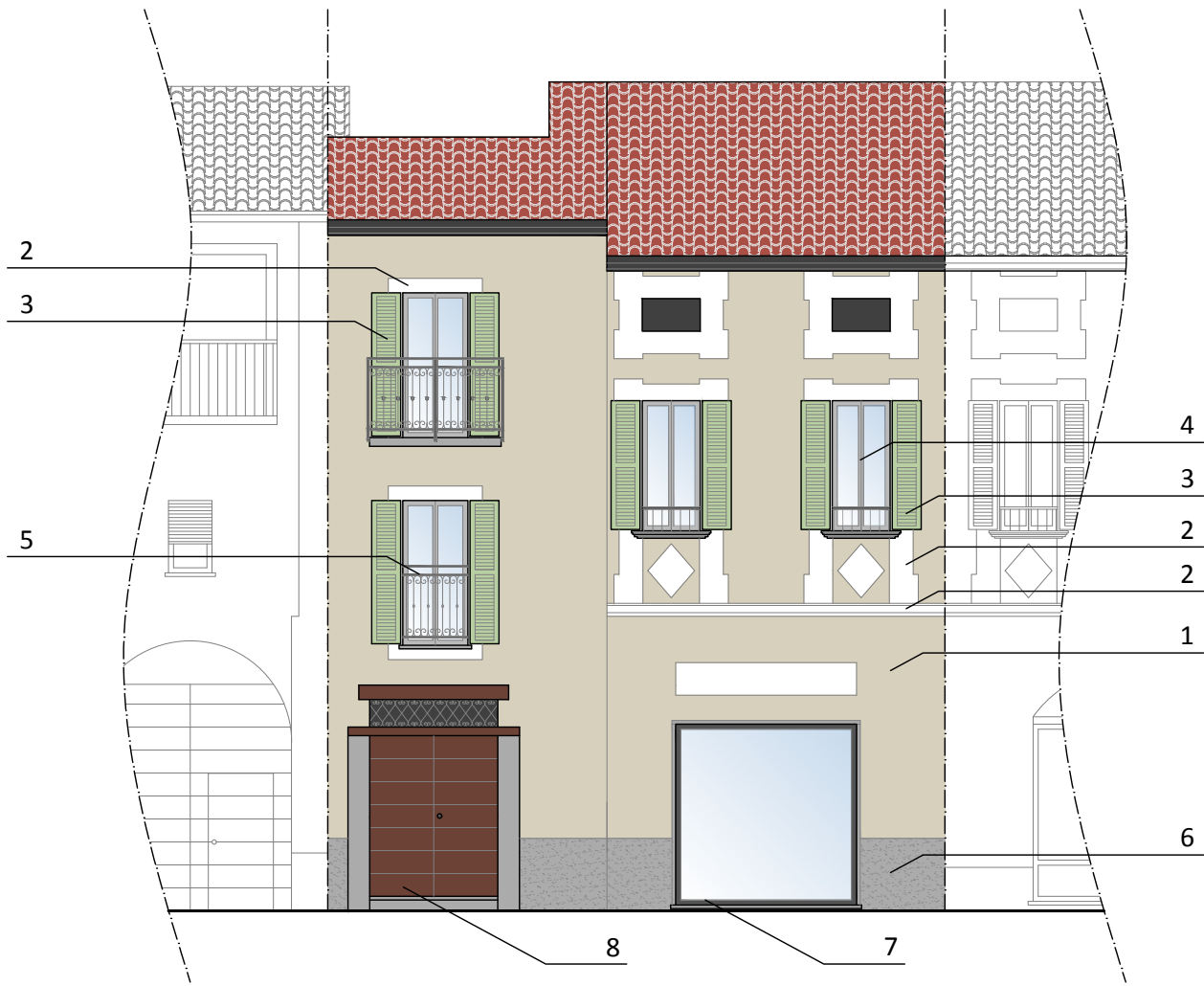
PROSPETTO SUD Stato di progetto